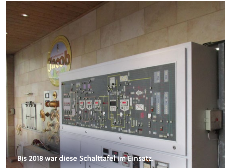
Bis 2018 war diese Schalttafel im Einsatz.

Übrigens: Der Bereich Steuerung war auch ein zentraler Auslöser der Modernisierung. Denn die Ersatzteilsituation der Schalttafel gestaltete sich zunehmend kritischer. Das Risiko einer ungeplanten Sudpause war demzufolge den Jacobs inzwischen einfach zu hoch.