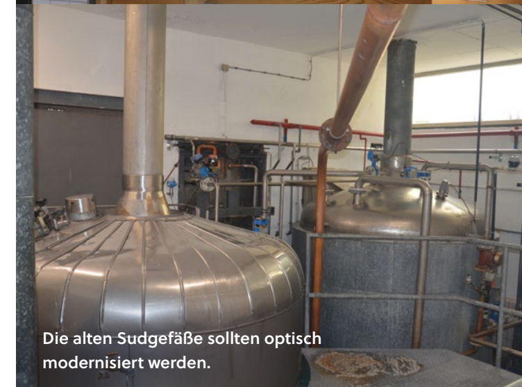
Die alten Sudgefäße sollten optisch modernisiert werden.