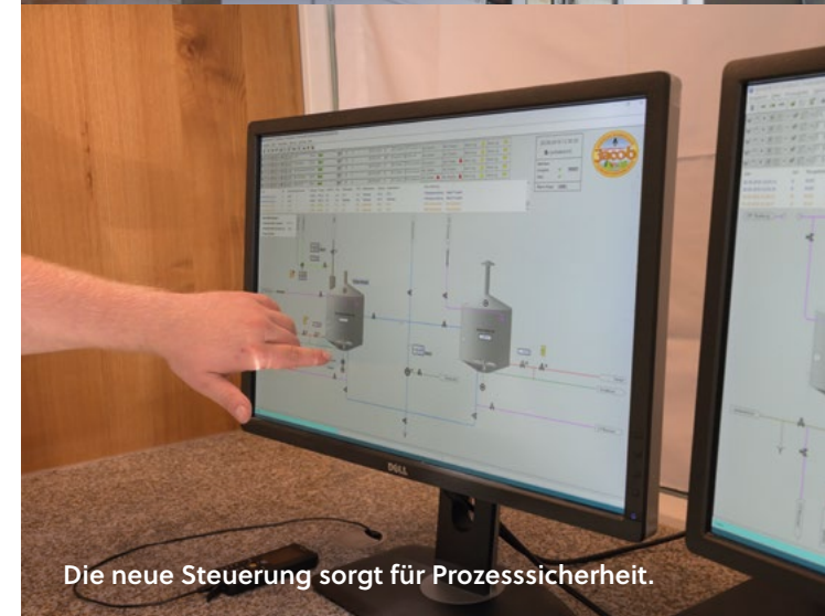
Die neue Steuerung sorgt für Prozesssicherheit.